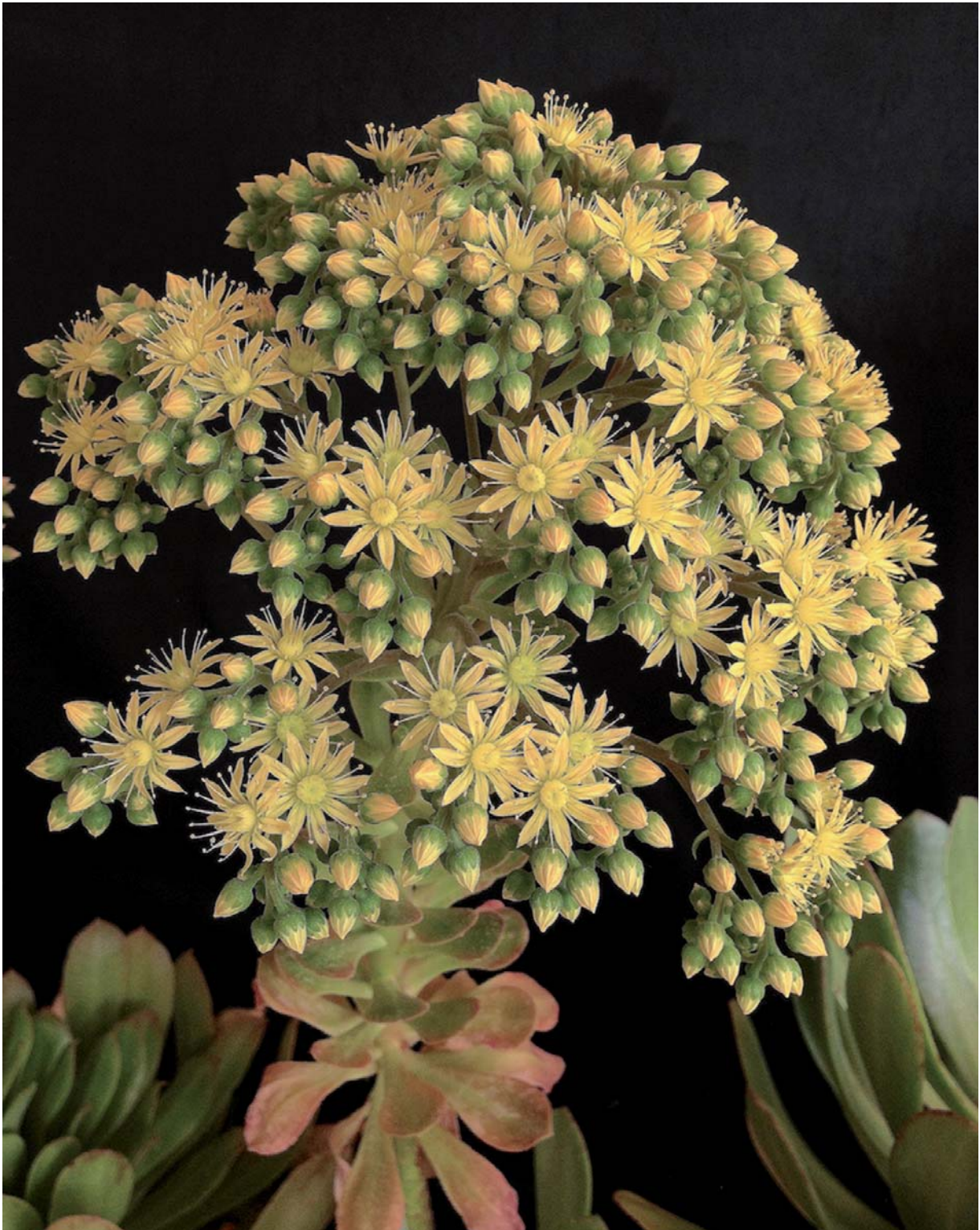
Figura 2.- Inflorescencia de un ejemplar en cultivo de Aeonium x claperae Arango nothosp. nov.